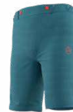
NEW 642642 HURRICANE