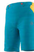
NEW 614735 TROPIC BLUE / BAMBOO