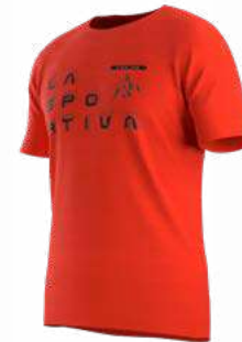
NEW 322322 CHERRY TOMATO