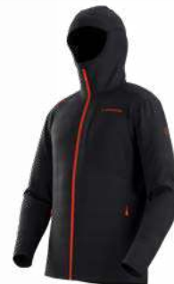
NEW 999322 BLACK / CHERRY TOMATO