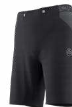
999900 BLACK / CARBON