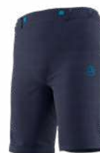
NEW 643643 DEEP SEA