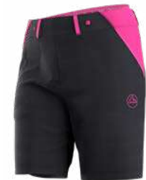
NEW 999411 BLACK / SPRINGTIME