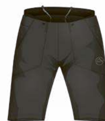
900999 CARBON / BLACK