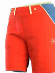
NEW 322644 CHERRY TOMATO / MOONLIGHT