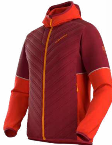
NEW 320322 SANGRIA / CHERRY TOMATO