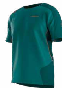
NEW 733733 EVERGLADE