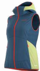
644736 MOONLIGHT / ZEST