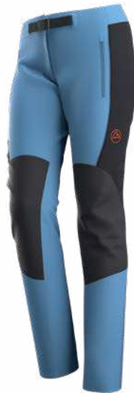
NEW 644999 MOONLIGHT / BLACK