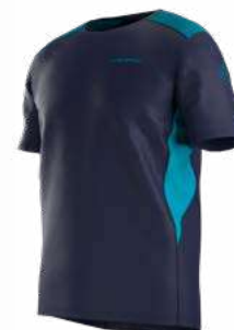
NEW 643614 DEEP SEA / TROPIC BLUE