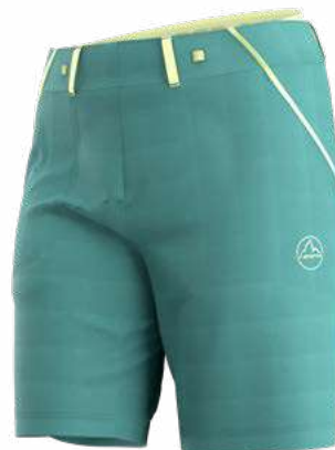
NEW 734734 JUNIPER