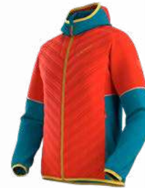
NEW 322614 CHERRY TOMATO / TROPIC BLUE