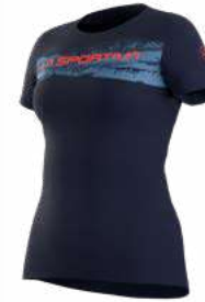
NEW 643643 DEEP SEA