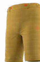
NEW 732732 SAVANA