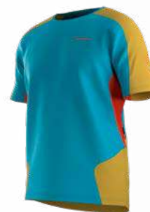
NEW 614735 TROPIC BLUE / BAMBOO