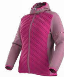
NEW 411412 SPRINGTIME / ROSE