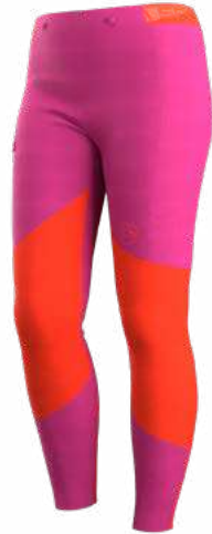
NEW 411411 SPRINGTIME