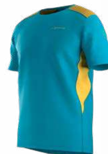
NEW 614735 TROPIC BLUE / BAMBOO