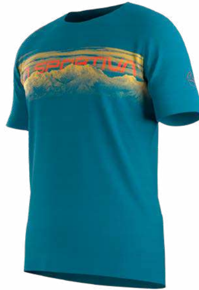
NEW 614614 TROPIC BLUE