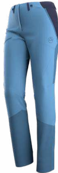
NEW 644643 MOONLIGHT / DEEP SEA