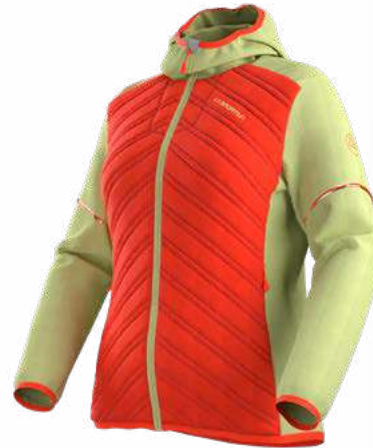
NEW 322736 CHERRY TOMATO / ZEST