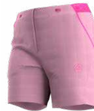
NEW 412412 ROSE