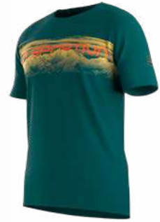
NEW 733733 EVERGLADE