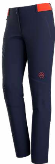
NEW 643643 DEEP SEA