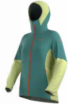
734736 JUNIPER / ZEST