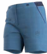
NEW 644644 MOONLIGHT