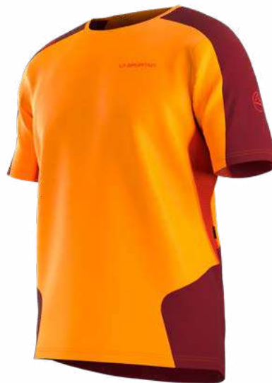
NEW 102320 PAPAYA / SANGRIA