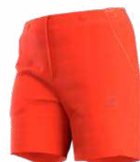
322322 CHERRY TOMATO