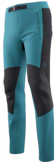
NEW 642999 HURRICANE / BLACK