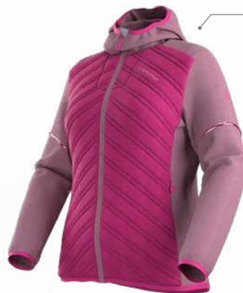
ART. Q46 KORO JKT W P. 149