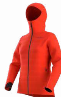
NEW 322322 CHERRY TOMATO