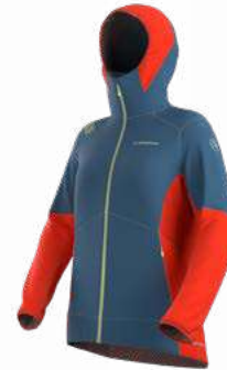
644322 MOONLIGHT / CHERRY TOMATO