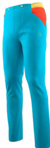
NEW 614322 TROPIC BLUE / CHERRY TOMATO