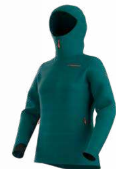
NEW 733733 EVERGLADE