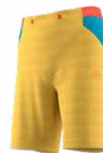
NEW 735614 BAMBOO / TROPIC BLUE