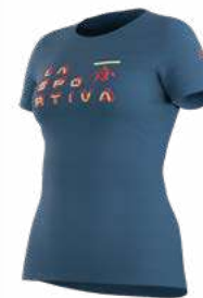
NEW 644644 MOONLIGHT