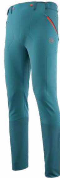
NEW 642642 HURRICANE