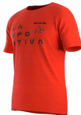
ART. P80 RAISING T-SHIRT M P. 142