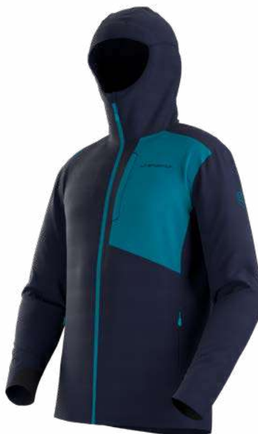
NEW 643614 DEEP SEA / TROPIC BLUE