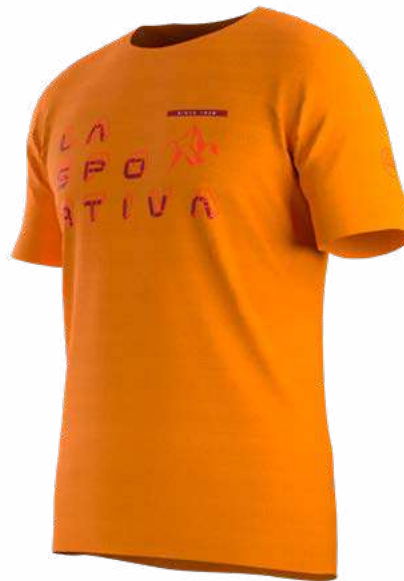
NEW 102102 PAPAYA