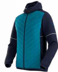
NEW 643614 DEEP SEA / TROPIC BLUE