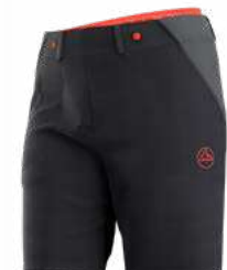
999322 BLACK / CHERRY TOMATO