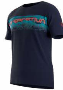
NEW 643643 DEEP SEA