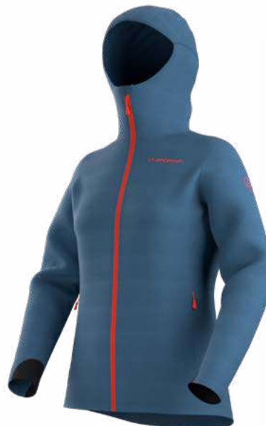
NEW 644644 MOONLIGHT