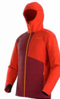
NEW 320322 SANGRIA / CHERRY TOMATO