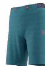
NEW 642642 HURRICANE