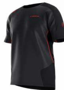
NEW 999322 BLACK / CHERRY TOMATO