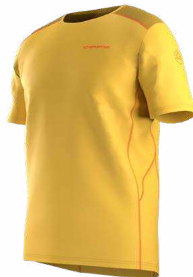
NEW 735735 BAMBOO