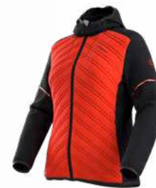
322999 CHERRY TOMATO / BLACK