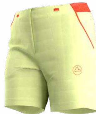
NEW 736736 ZEST