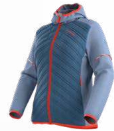
NEW 644645 MOONLIGHT / STONE-BLUE