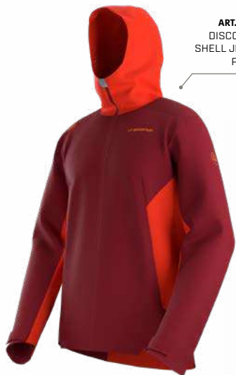
ART. P92 DISCOVER SHELL JKT M P. 135