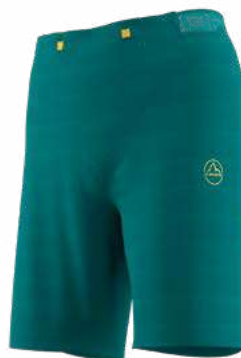
NEW 733733 EVERGLADE