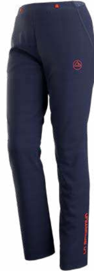
NEW 643643 DEEP SEA