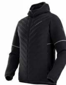
999907 BLACK / CLOUD