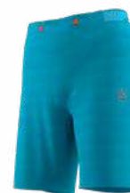
NEW 614614 TROPIC BLUE