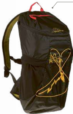
ART. 59Q X-CURSION BACKPACK P. 319