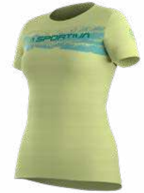
NEW 736736 ZEST