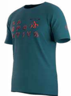
NEW 642642 HURRICANE