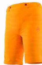
NEW 102102 PAPAYA