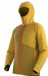
NEW 732735 SAVANA / BAMBOO