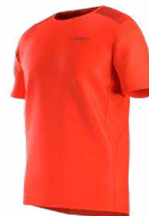
NEW 322322 CHERRY TOMATO