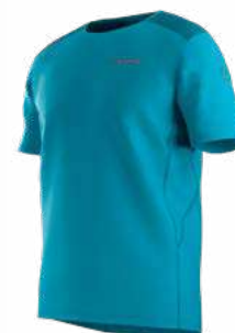
NEW 614614 TROPIC BLUE